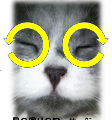
目の周りのマッサージ

毎日のお顔拭きで、頑固な汚れになってしまうのを防ぎます。眼の周りを円を描くように優しくマッサージしてあげると涙やけ予防になります。濡らしたガーゼやティッシュで優しく目ヤニや口の周り、鼻水、耳垢等を拭いてあげてください。いつもの臭いや皮膚の赤み、目ヤニの色、耳垢の色を覚えておいて下さい。違いがあるようなら動物病院へ連れて行って下さい。